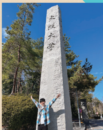
榮 伝心 大阪大学 基礎工学部 システム科学科 在籍 (2023年度卒)

国際英語科の卒業生であった姉から勧められて入学を決めました。また、数学が得意であったため、サイエンスコースを選びました。英語でのプレゼンテーションやディベートは、最初は難しく感じましたが、回数を重ねるうちに実践的な英語力を身につけることができ、自分の大きな場所となりました。