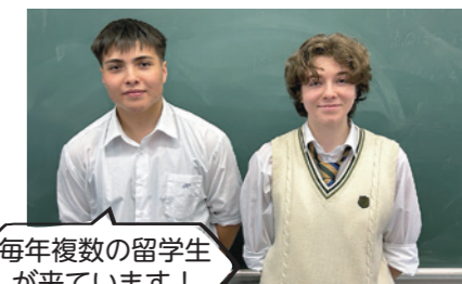
毎年複数の留学生 が来ています！

世界の様々な課題について、対話やディベート、プレゼンテーション、文章で自分の意見を表現することなどを通して、さらに高い英語力と表現力を身につけます。