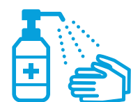
手指消毒用 アルコールによる 消毒の励行