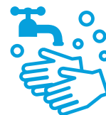
石けんによる 手洗い